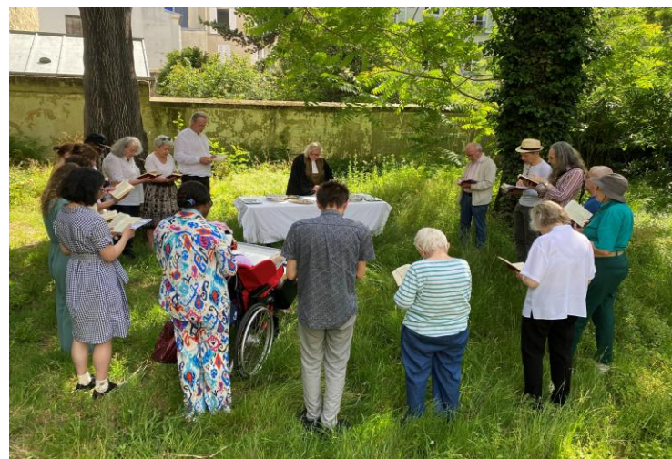
Cène dans le jardin de la Maison Fraternelle 24 mai 2026

En pensées et prières avec nos sœurs et frères, de toute confession, en zones de guerre partout dans le monde et, plus spécialement, avec notre paroisse jumelle de Goma au Congo.